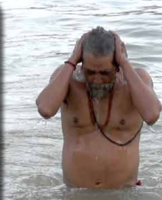
அறியல் ரீதியாக பார்க்கும் போது, முதல் முதுகை துடைக்க முன்னோர் சொன்ன காரணம் வியப்பாக இருக்கும்.

இனியாவது நாம் குளிக்கும்போது காக்கா குளியல் குளிக்காமல் குளிக்கும் நோக்கத்தை அறிந்து குளிப்போம் நமது சந்ததிக்கும் முன்னோர் சொல்லிக் கொடுத்த குளியல் முறையை எடுத்துச் சொல்லி அவர்களுக்கு வழிகாட்டுவோம்.